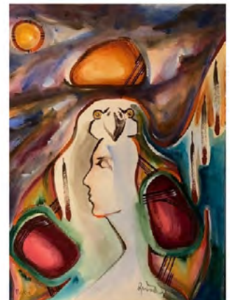
Rene Meshake, Acrylique, 23 x 30 po

D'autres détails suivront prochainement!