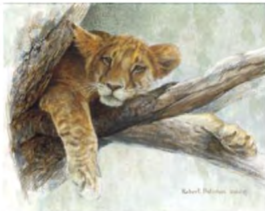
Robert Bateman, Lithographie, En haut d'un arbre - Club Lions, 8 x 10 po