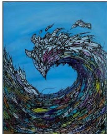
France Couillard, Acrylique, Poésie de l'eau, 16 x 20 po